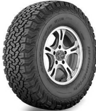
Camioneta 235 / 70 / R-16 MT