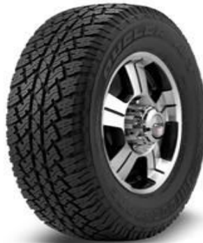
Jepp Jimny 205 / 70 / R-15 AT