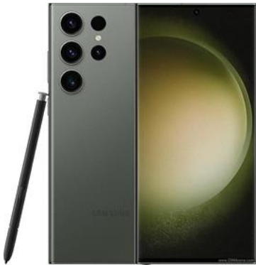
SAMSUNG GALAXY S 23 ULTRA