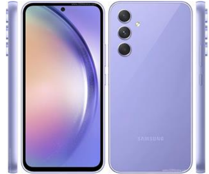
SAMSUNG GALAXY A 54