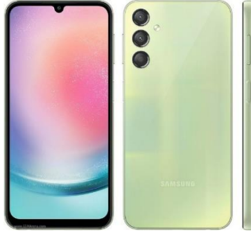
SAMSUNG GALAXY A 24