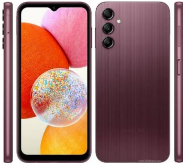
SAMSUNG GALAXY A 14